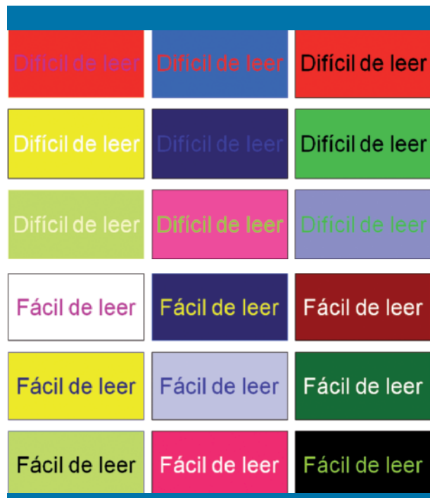
Figura 4. Tipos de colores y contraste entre fondo y letra