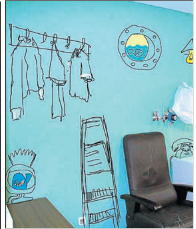
Imagen del control de enfermería, en el que se ha dibujado una pecera. A la derecha, recreación de cómo quedará una de las estancias de la planta.

Proyecto «Como en casa». El control de enfermería se ha convertido en una relajante pecera y, en breve, los dibujos también se colarán en las habitaciones donde los niños y sus padres pasan largas temporadas. Alumnos de Bellas Artes de la UMH están decorando el área de oncología pediátrica del Hospital General de Alicante con un proyecto que trata de desdramatizar el entorno médico.