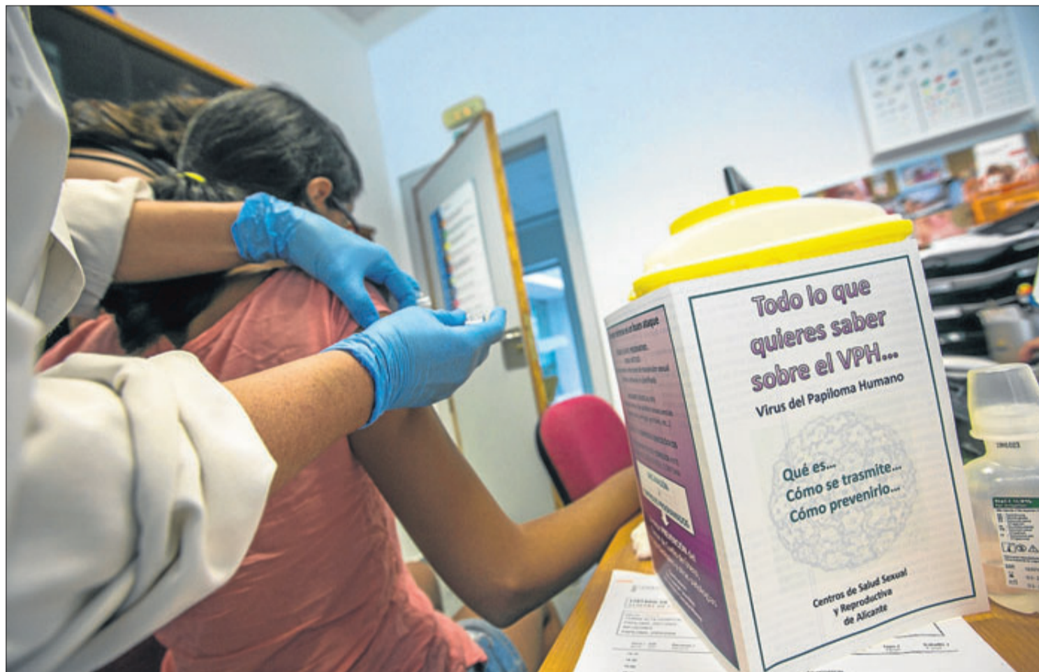
Una enfermera vacuna a una joven contra el virus del papiloma humano. ANTONIO AMORÓS

La presencia de los antivacunas en las redes sociales puede ser más peligrosa para los jóvenes de lo que en un principio puede parecer. Y es que si bien hasta los 16 años no se considera mayoría de edad para que los jóvenes tomen decisiones a nivel sanitario, «entre los 12 y los 16 años se considera que son maduros para participar en determi-